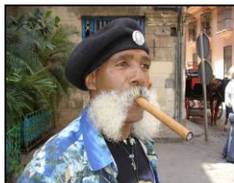
Nostalgi i Havanna

Dag 10 - mandag 21. februar: Fridag i Varadero som ligger 140 km fra Havanna og er Cubas fremste område for sol- og badeferie. Varadero tilbyr vakre, hvite strender, krystallklar blågrønn sjø og godt utbygd infrastruktur og aktivitetstilbud. På hotellet har vi all mat og drikke inkludert og kan nyte sol og sommer før vi igjen setter kursen mot nord ... (Full pensjon / all inclusive)