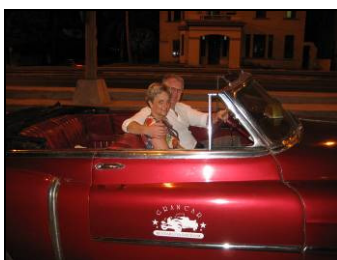
Amerikaner i Havanna

Dag 5 - onsdag 16. februar: I dag har vi lagt opp til fritid i eksotiske Havanna. Reiseleder er behjelpelig med forslag til opplevelser og gjøremål. Vi anbefaler et besøk på det berømte Revolusjons-muséet som gir et godt innblikk i Fidel Castro og Che Guevara's imponerende innsats for å felle det sittende Batista-regimet på slutten av 1950-tallet. Muséet holder hus i regjeringspalasset, selve hjertet til det gamle regimet! Om kvelden tilbyr reiseleder felles middag i Hemingway's stamkafe El Floridita for dem som har lyst. For øvrig er det godt utvalg av gode restauranter i gangavstand fra vårt hotell. (Kun frokost inkludert)